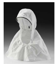
Cubierta para cabeza, cuello y hombros para modelo M-307