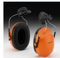
Fonos para casco 3M Peltor compatible con M-307 NRR=24dB